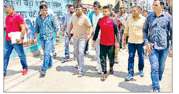
जींद। बाजार से आरोपियों को लेकर जाते पुलिस कर्मचारी।