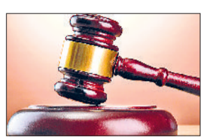
अनुच्छेद 21 के तहत व्यक्तिगत स्वतंत्रता के अधिकार अहम