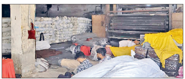
पानीपत। एक फैक्ट्री में मशीनें बंद होने की वजह से आराम करते श्रमिक।

अपने-अपने गांव चले गए हैं। वहीं, इन उद्योगों से जुड़े दुकानदार भी धंधा बंद होने की वजह से परेशान हैं। गौर करने लायक है कि अमेरिका-इजरायल-ईरान युद्ध शुरू होने के तीन दिन बाद ही सरकार की ओर फैक्ट्री संचालकों को गैस सप्लाई बंद करने का नोटिस दे दिया गया था। अब जब युद्ध विराम का ऐलान हुआ है तो उद्योगों को उम्मीद है कि जल्द हालात सामान्य होंगे और फैक्ट्रियां फिर गति पकड़ेंगी। आउटर फैक्ट्रियों में पीएनजी न होने से लगे ताले : पानीपत में छोटी-बड़ी करीब 38 हजार फैक्ट्रियां हैं। आउटर की फैक्ट्रियां बंद हो चुकी हैं। पानीपत के इंडस्ट्रियल एरिया में भी वो ही