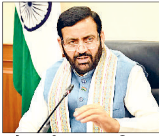
गेहूँ खरीद का 75 प्रतिशत सत्यापन पूरा : नायब

चंडीगढ़। मुख्यमंत्री नायब सिंह सैनी ने कहा कि राज्य सरकार किसानों की फसल के एक-एक दाने की खरीद के लिए पूरी तरह प्रतिबद्ध है। उन्होंने आरोप लगाया कि विपक्ष खरीद व्यवस्था को लेकर बेवजह दुष्प्रचार कर किसानों को गुमराह करने की कोशिश कर रहा है। मुख्यमंत्री ने कहा कि तीन-स्तरीय सत्यापन, बायोमेट्रिक और जियो-फेंसिंग से खरीद व्यवस्था मजबूत हुई है। मुख्यमंत्री ने बताया कि खरीद प्रक्रिया को सुचारु बनाने के लिए वरिष्ठ अधिकारियों को जिलों की मंडियों की नियमित निगरानी की जिम्मेदारी सौंपी गई है, जबकि उपायुक्तों (डीसी) को जिला स्तर पर प्रभारी बनाया गया है। मंत्री और विधायक भी लगातार मंडियों का दौरा कर रहे हैं ताकि किसानों को किसी प्रकार की परेशानी न हो। सरकार ने खरीद प्रणाली में पारदर्शिता और सुरक्षा बढ़ाने के लिए कई तकनीकी सुधार लागू किए हैं। तीन-स्तरीय फसल सत्यापन प्रणाली को अनिवार्य किया गया है, जिससे मंडियों में लाई गई फसल का पंजीकृत विवरण से मिलान सुनिश्चित होगा। इसके लिए सभी प्रकार की तैयारियां की चुकी हैं।